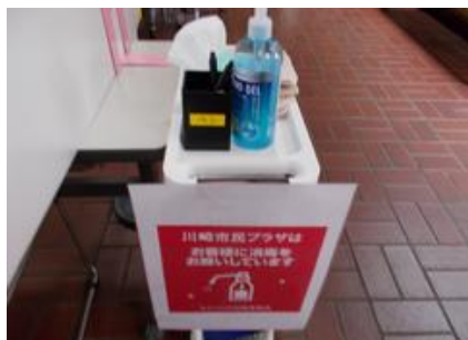
来館時の手指消毒ご依頼