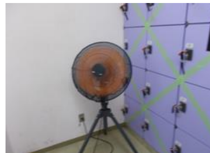
ロッカーの使用停止