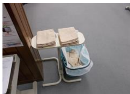
ご利用者による接触個所の消毒