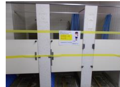
個別シャワーの使用停止