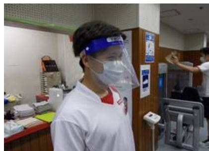
トレーニングルームスタッフの フェイスシールド着用