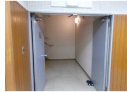
トレーニングルーム非常口開放