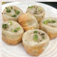
めぐみキッチンカー