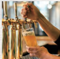
TDM 1874 Brewery