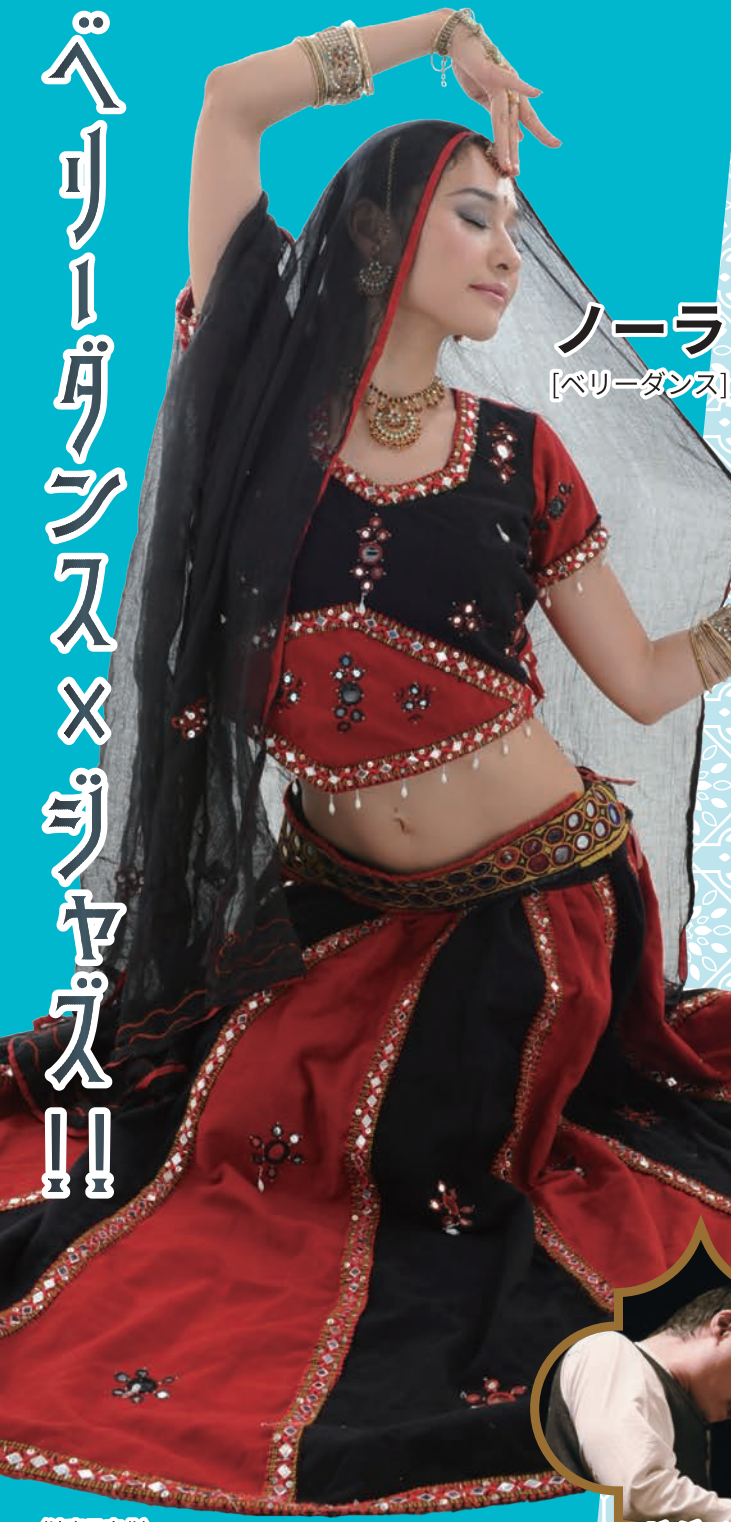
ノーラ [ベリーダンス]