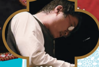
スガダイロ [ピアノ]